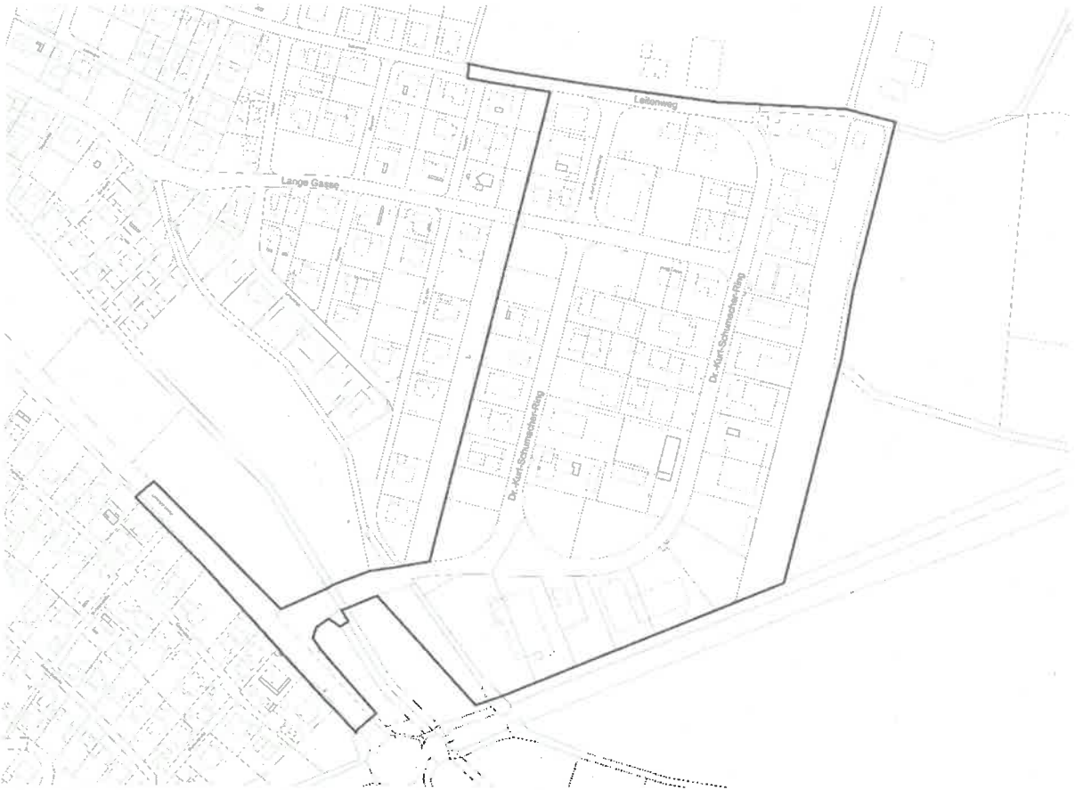
Lageplan des räumlichen Geltungsbereiches des Bebauungsplans o. M., (Kartengrundlage Geobasisdaten © Bayerische Vermessungsverwaltung 2020)

Die Verarbeitung personenbezogener Daten erfolgt auf der Grundlage der Art. 6 Abs. 1 Buchstabe e (DSGVO) i. V. m. § 3 BauGB und dem BayDSG. Sofern Sie Ihre Stellungnahme ohne Absenderangaben abgeben, erhalten Sie keine Mitteilung über das Ergebnis der Prüfung. Weitere Informationen entnehmen Sie bitte dem Formblatt „Datenschutzrechtliche Informationspflichten im Bauleitplanverfahren“ das ebenfalls öffentlich ausliegt.